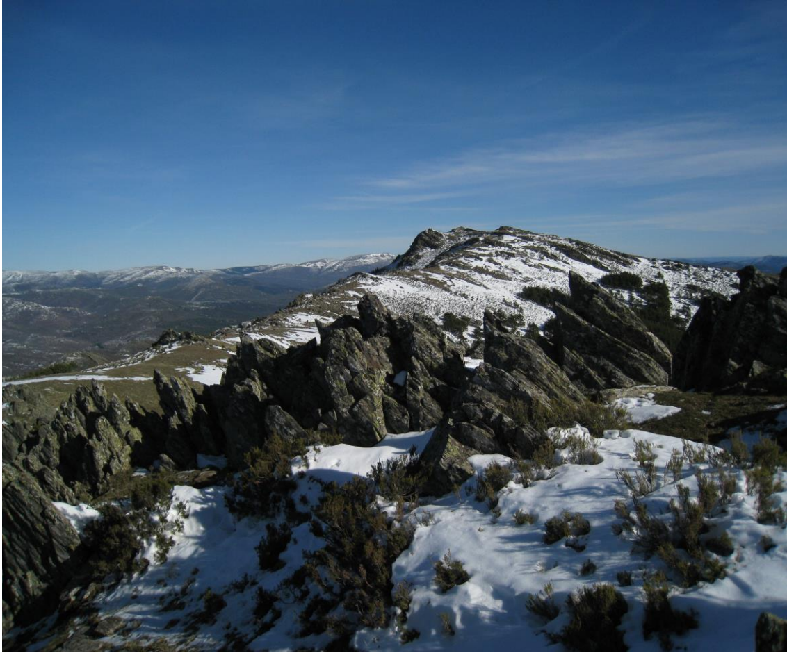
FOTO 6 LOS VIGILANTES Y AL FONDO EL SUAVE CORDEL Y LA CIMA.