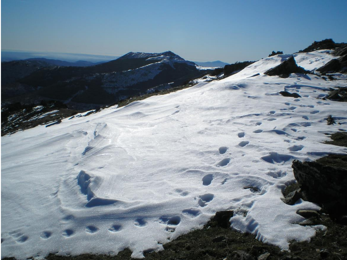
FOTO 2 EN LA LADERA NORTE SI SE ACUMULA NIEVE EN INVIERNO (EL PORREJON AL FONDO)