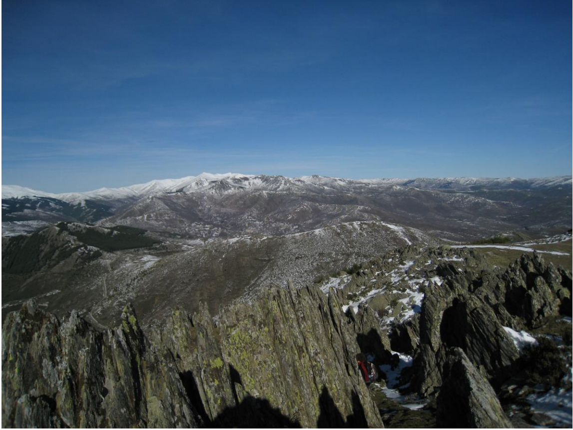
FOTO 4 LOS SOLDADOS PETREOS VIGILANDO LA SIERRA..