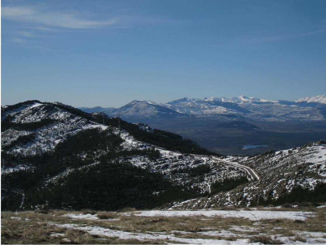
FOTO 3 FIJANDOSE BIEN EN EL COLLADO SE VE EL APARCAMIENTO DONDE SE DEJAN LOS VEHÍCULOS.