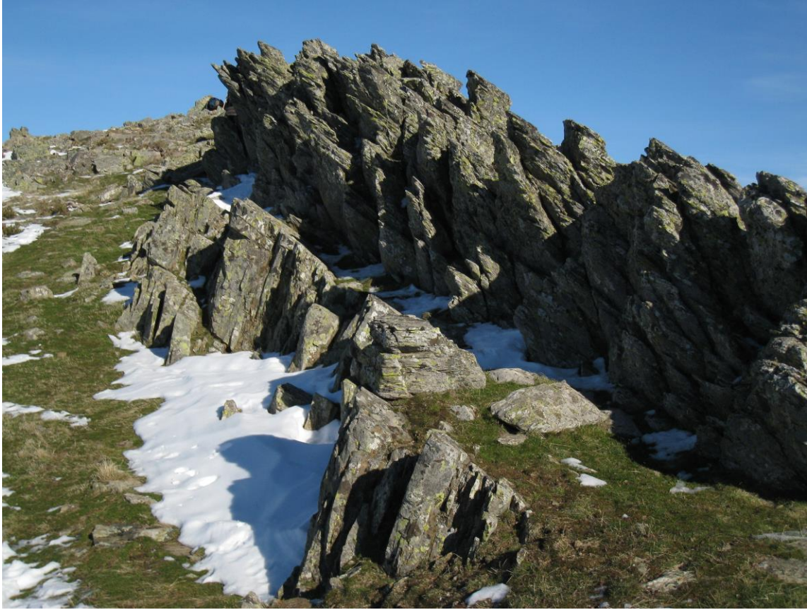
FOTO 5 EL SENDERO HACIA LA CIMA, TAMBIEN ESTA VIGILADO POR ELLOS.