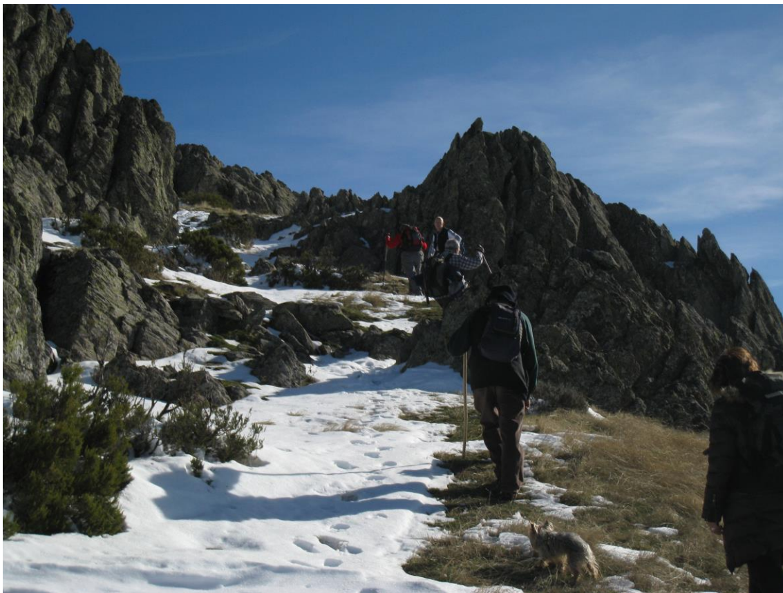
FOTO 1 TODA LA SUBIDA ES EN SUAVE ASCENSO Y COMODA, INCLUSO CON ALGO DE NIEVE.